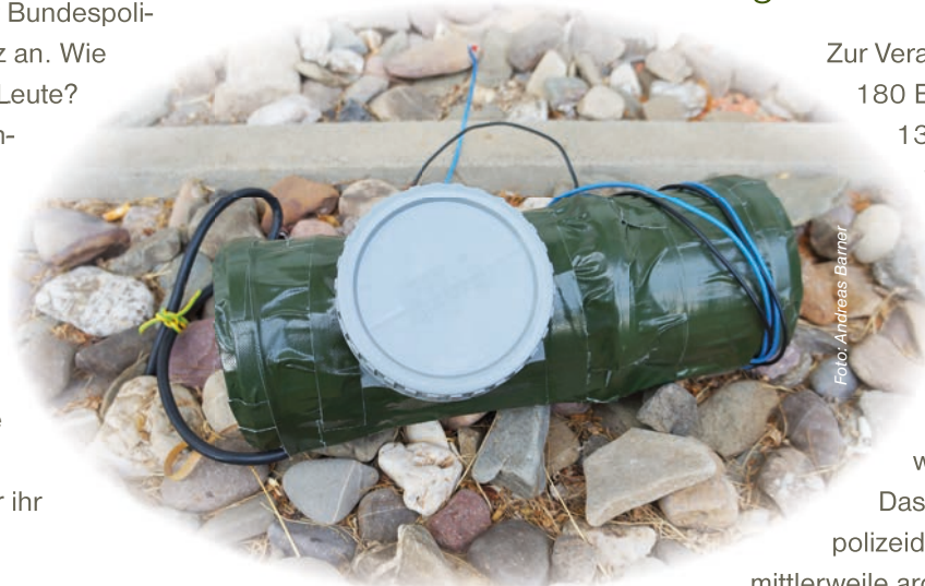
Nachbildung eines Geocache-Behälters, wie er 2006 in Herne gefunden wurde und eine mehrstündige Sperrung von Bahnanlagen sowie den Einsatz von Entschärfern der Bundespolizei zur Folge hatte.

Das Event der Bundespolizeidirektion Koblenz ist mittlerweile archiviert, kann aber noch unter www.geocaching.com eingesehen werden http://coord.info/GC4BM53 (kostenlose Registrierung erforderlich). Die nächsten Events sind bereits für den Hessentag 2014 in Bensheim und für den Rheinland-Pfalz-Tag 2014 in Neuwied in Vorbereitung.