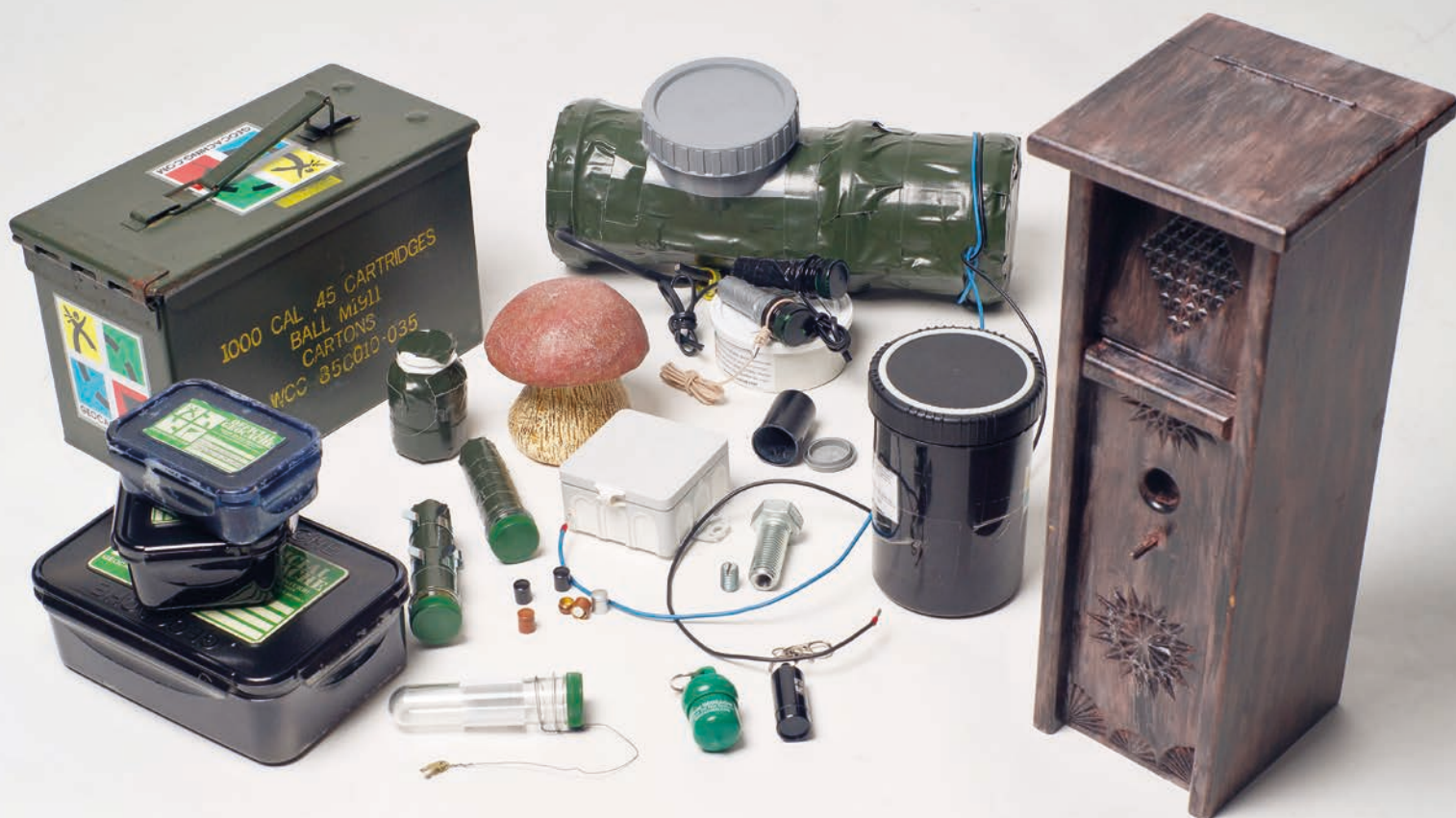
Es gibt zahlreiche Gegenstände und Möglichkeiten um einen Cache zu verstecken

Verstecke im Internet zu veröffentlichen. Ein anderer fand anhand der Koordinaten den Gegenstand und gab dem „Verstecker“ eine Rückmeldung. Rasend schnell bekam das neue Spiel immer mehr Zuspruch und Anhänger. Dreizehn Jahre später gibt es mehrere Internetplattformen, auf denen sich die Geocacher austauschen. Auf der führenden Plattform www.geocaching.com sind weltweit mehr als sechs Millionen aktive Geocacher registriert, die zirka 2,3 Millionen Geocaches veröffentlicht haben.