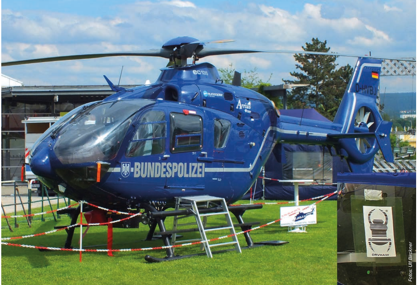
Beim Hessentag 2013 in Kassel konnten die Geocacher den Polizeihubschrauber der Bundespolizei als Trackable loggen.

Auch wenn das Geocacheevent mittlerweile schon lange beendet ist, zeigt die Beteiligung der Bundespolizei an diesem Spiel noch immer Wirkung. Am Tag der Veranstaltung wurden 38 sogenannte Trackables (siehe Infokasten) in Umlauf gebracht: Jedes Mal, wenn ein Geocacher