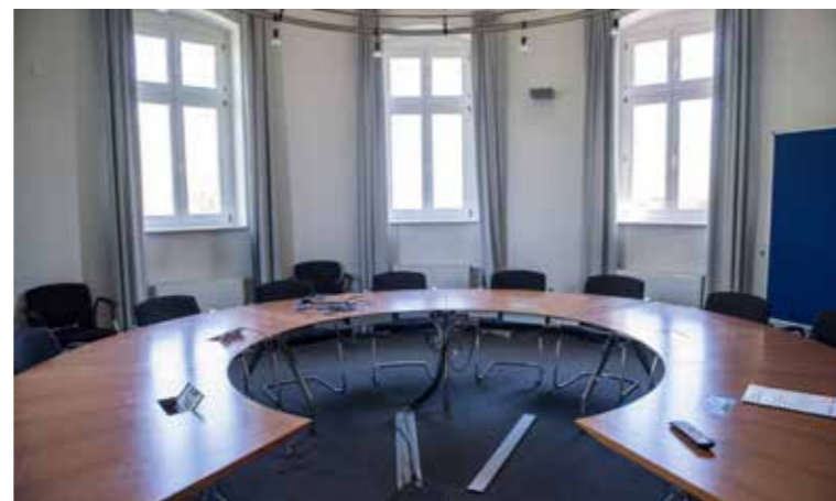
Kaum vorstellbar: In diesen Türmen befinden sich die Besprechungsräume.