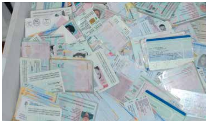
▲ +▶▶ Sicherstellung von Pässen, Identitätskarten, Führerscheinen sowie sonstiger Ausrüstung zur Fälschung von Ausweispapieren