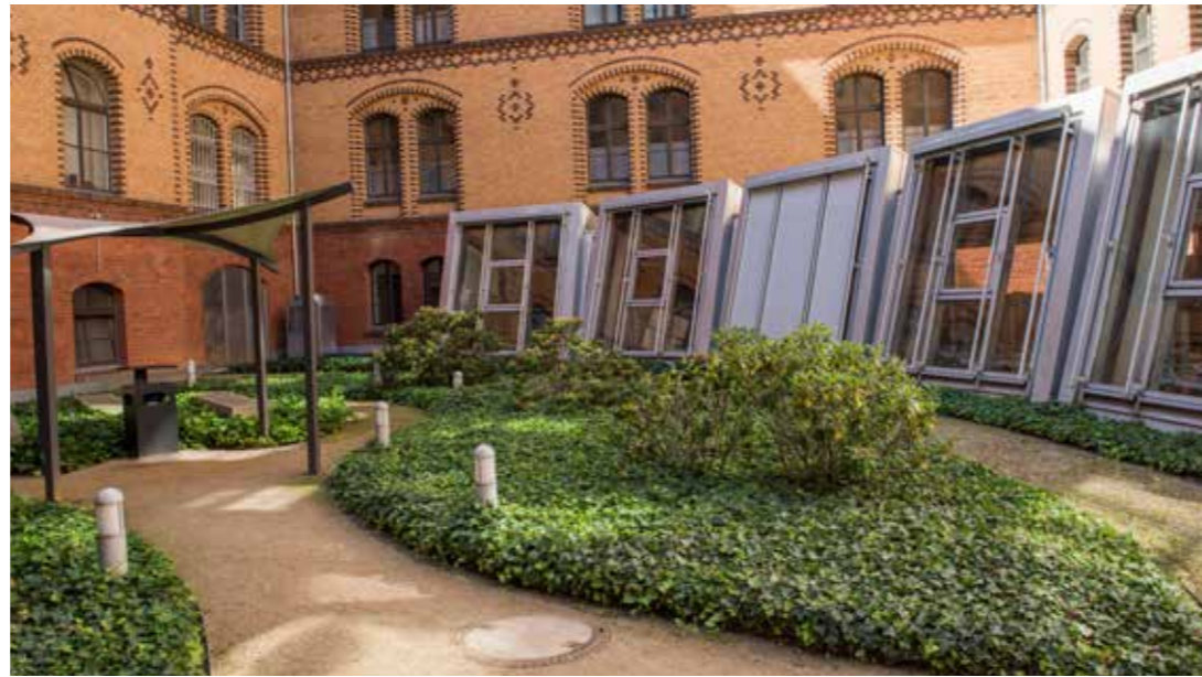
Einer von zwei Innenhöfen der Bundespolizeidirektion 11