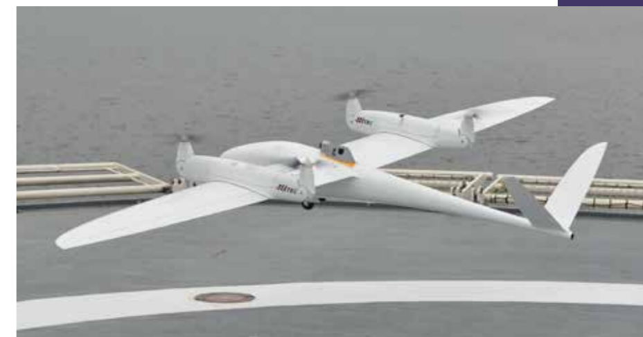
▲ Ein Hybrid-UAS: UAS TRON der Firma Quantum-Systems aus Gilching bei München

Geräte zu stellenden Anforderungen für Datenschutz verhindern zudem, dass die von chinesischen Herstellern mitgelieferten Apps zur Steuerung und Bildarchivierung nutzbar sind, da diese Hersteller offen zugeben, dass sie die Daten den chinesischen Behörden auf Anforderung zur Verfügung stellen. Die Nutzung öffentlicher Frequenzen (WLAN-Bereich) für Steuerung und Datenstreaming stellt weitere Anforderungen an Schutzanforderungen für eine polizeiliche Nutzung. Polizeiliche Kryptierungsverfahren müssen den Bestimmungen des Datenschutzes entsprechen, bevor ein regelmäßiger Einsatz in der Fläche erfolgreich gelingen kann.