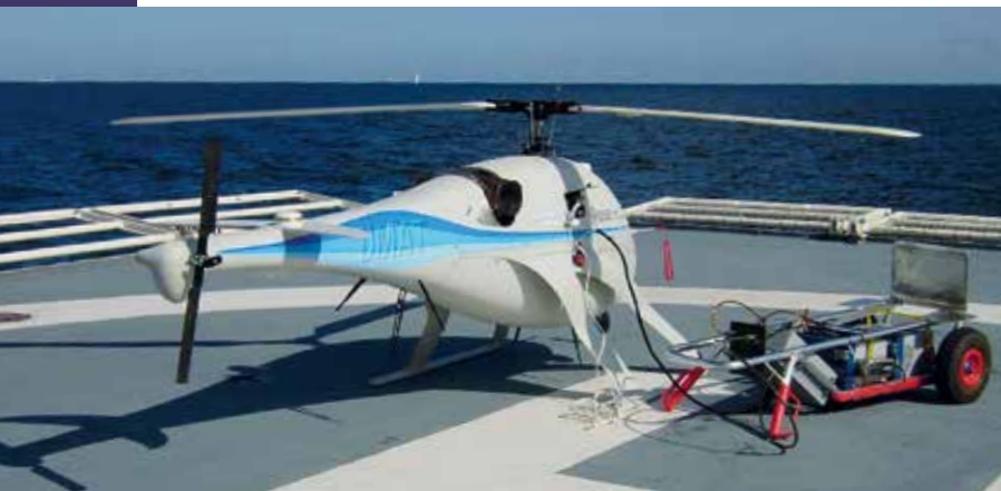
▲ Mit dem System Neo S-300 der Firma SwissDrone haben Decklandungen auf BP 21 stattgefunden.

Seit dem Jahr 2000 befasst sich die Bundespolizei mit dem Thema Einsatz von unbemannten Luftfahrtsystemen (englisch: Unmanned Aircraft Systems – UAS). Zunächst hat die GSG 9 der Bundespolizei auf theoretischer Basis die Verwendbarkeit für Zwecke der Spezialeinheit untersucht. Ziel war hier, das Risiko der Verletzung von Polizeibeamten im Einsatz gegen hoch aggressive und gewalttätige Störer, wie z. B. Terroristen, sowie bei Einsätzen im Zusammenhang mit Gefahrstoffen, z. B. radioaktive oder chemische Substanzen, zu verringern.