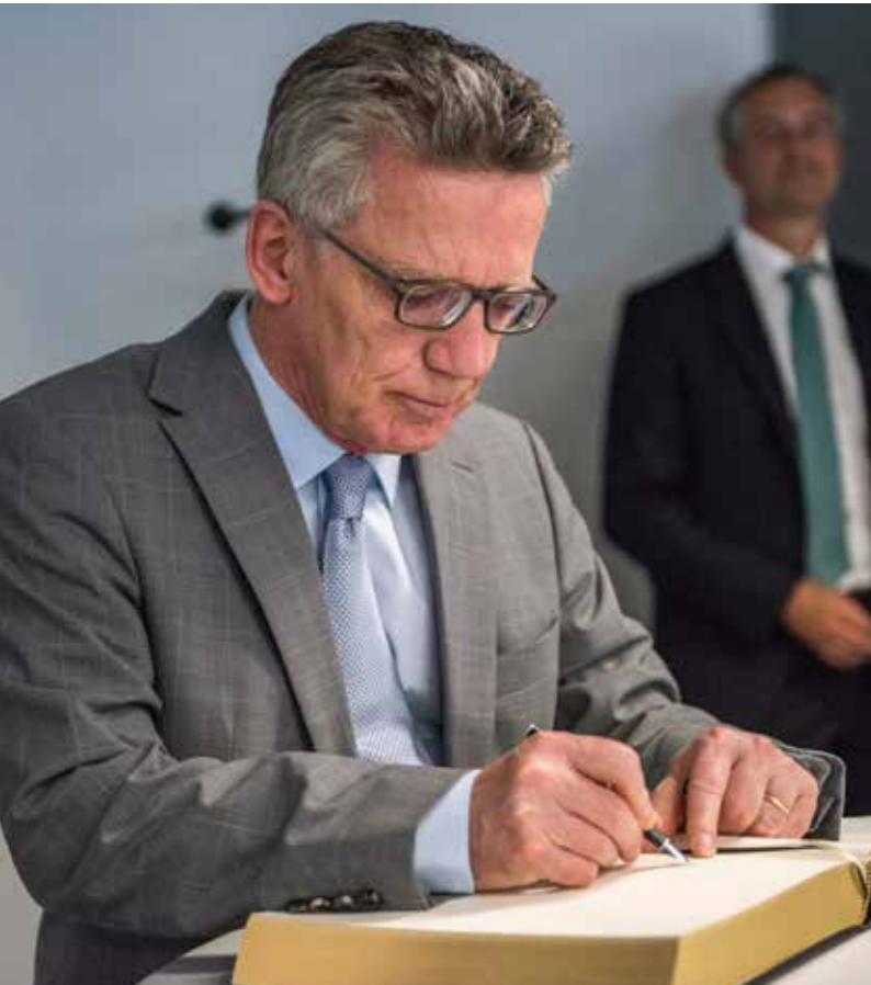
Bundesinnenminister Dr. Thomas de Maizière trägt sich ins Gästebuch der Bundespolizeidirektion 11 ein.