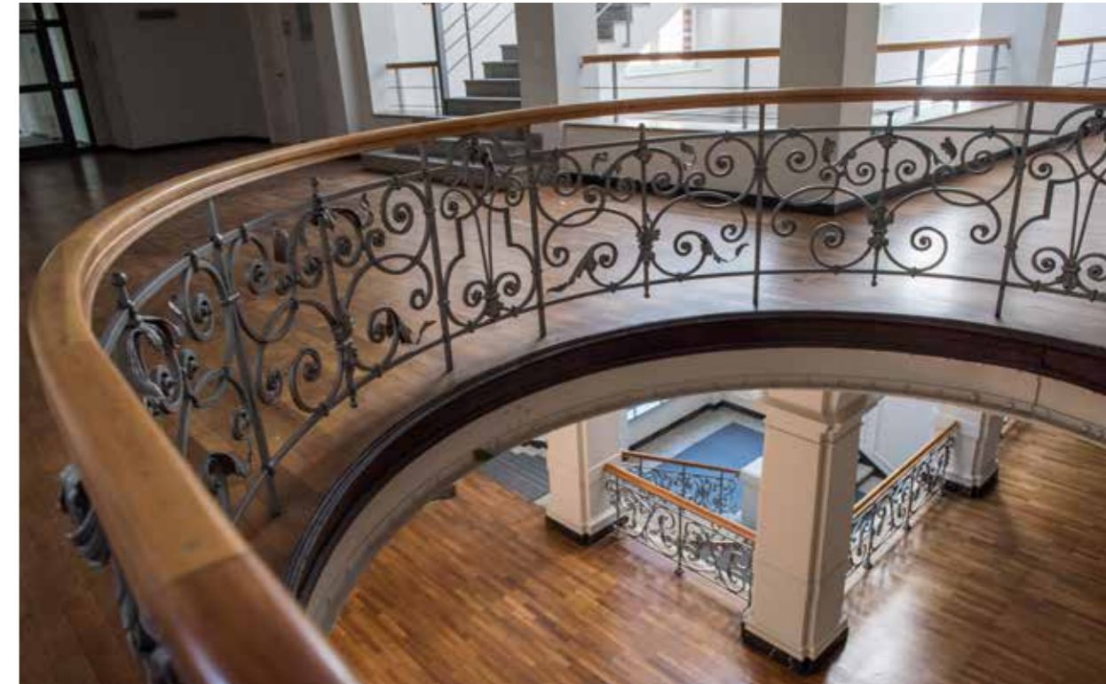
Altbaucharme trifft Moderne: Die verzierten Treppenaufgänge sind charakteristisch für das Gebäude.