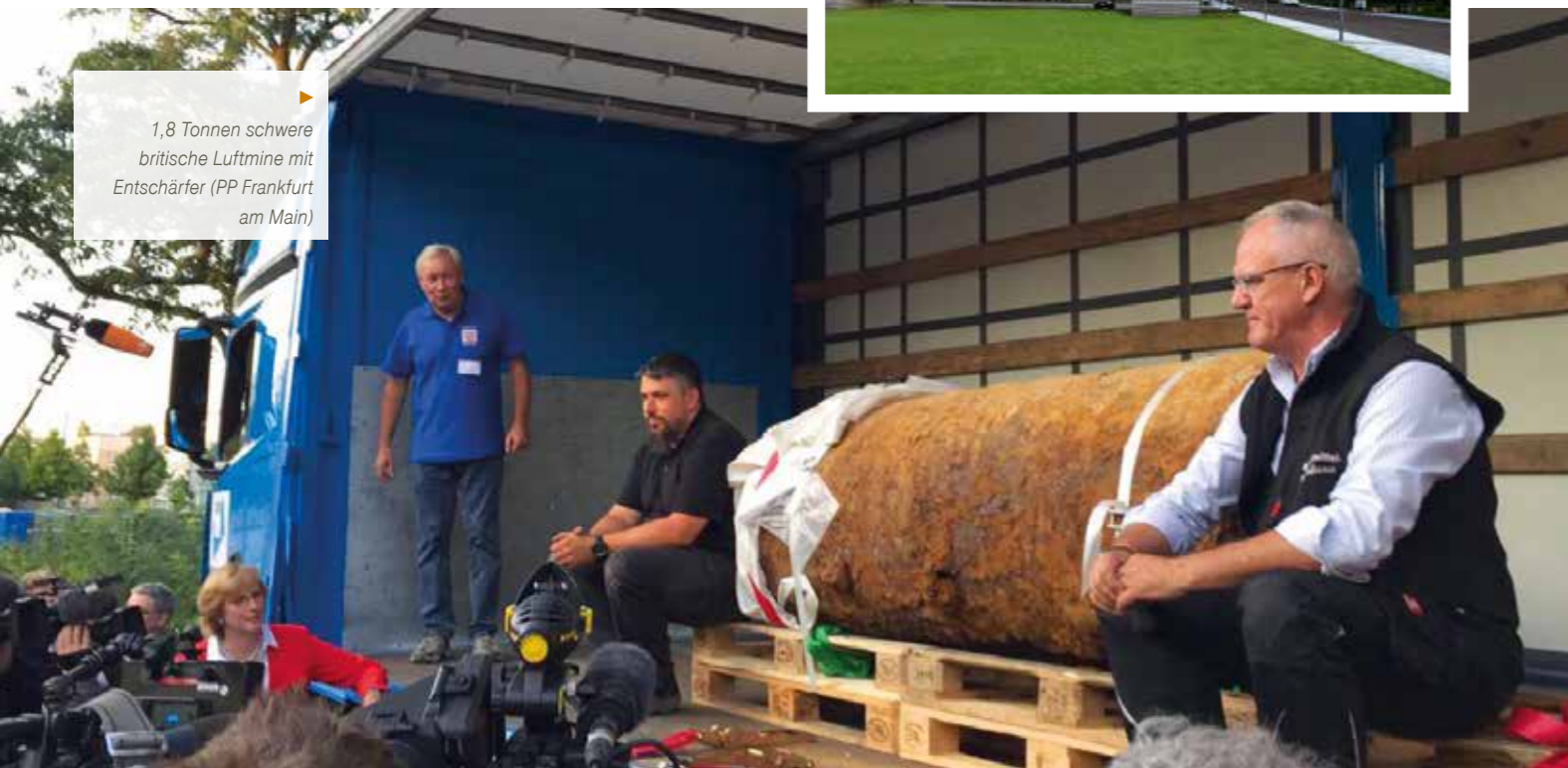
▶ 1,8 Tonnen schwere britische Luftmine mit Entschärfer (PP Frankfurt am Main)