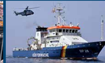
Maritime Aus- und Fortbildung